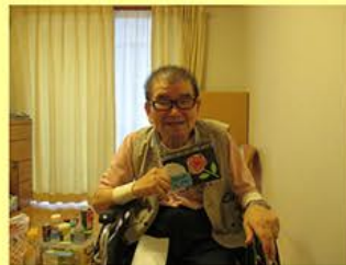
6月父の日は、カードをプレゼントしました。