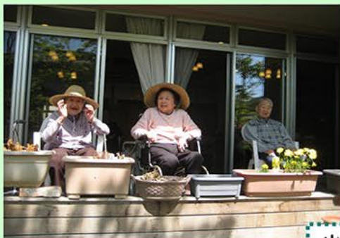
5月、陽気に誘われて、日光浴をしました。

1万人以上が出場する第1回おかやまマラソン。事前の申告で到着予測タイムを制限時間ぎりぎり申告していた為、スタート地点は、スタートラインのはるか後方、最後尾。先頭は全く見えません。有森裕子選手の激励の挨拶が聞えてきていよいよ、スタートのピストルが鳴ります。あとからわかった事ですが、ピストルからスタートラインにつくまで7分かかっていました。人生初体験のマラソンこのあと想像以上の長さ、苦しさ、完走できたのか。つづく。