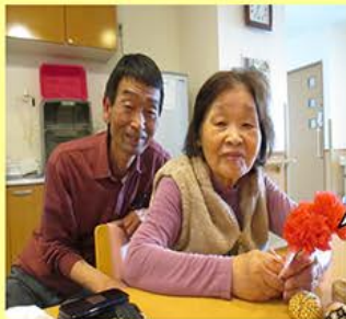
5月母の日、カーネーションをプレゼントしました。

5月の母の日・6月の父の日に、職員手作りの品物を、プレゼントしました。記念写真でお祝いしたり、家族写真の1枚になりました。