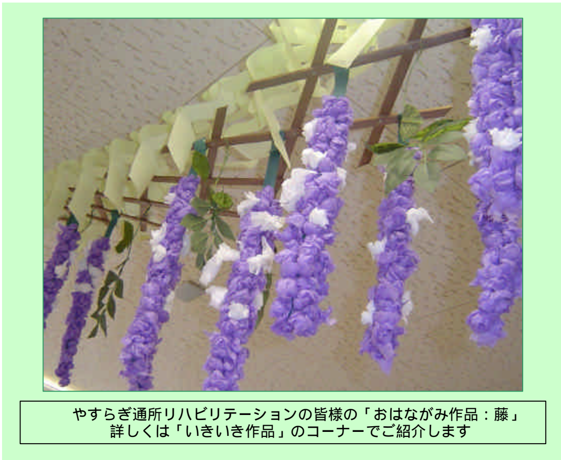
やすらぎ通所リハビリテーションの皆様の「おはながみ作品：藤」 詳しくは「いきいき作品」のコーナーでご紹介します