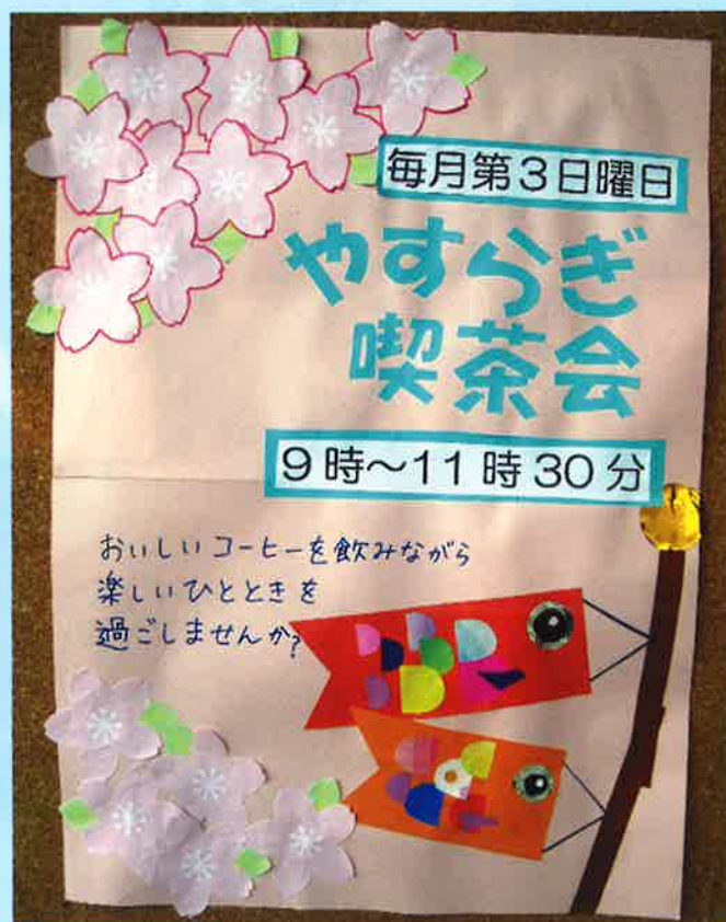
やすらぎ喫茶会、はじめました!! (詳細はページ2へ)