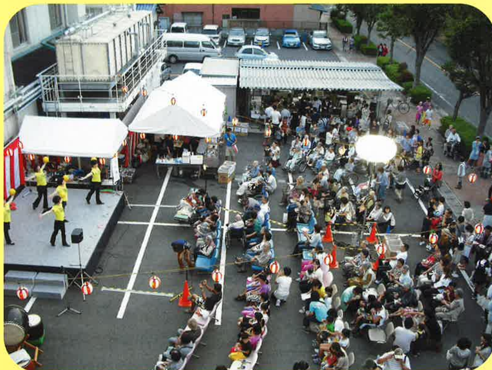
佐藤病院秋祭り、開催しました!! (詳細はページ1へ)