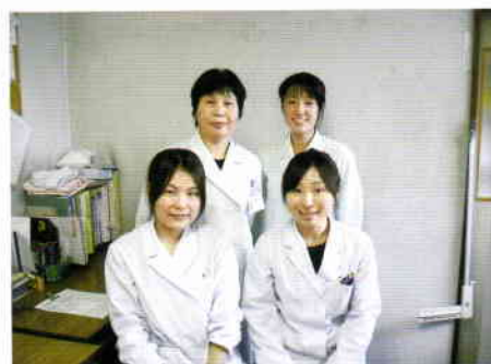
給食スタッフ一同