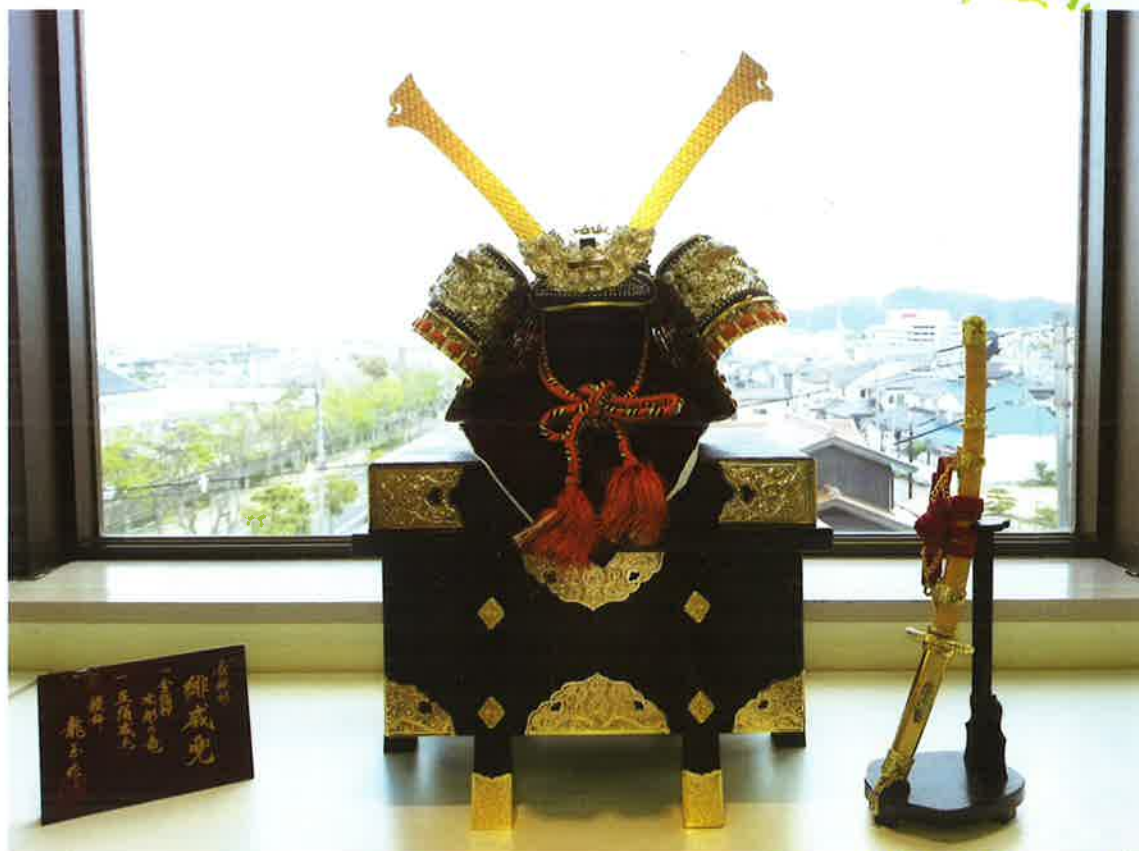
「療養棟ロビーにて」