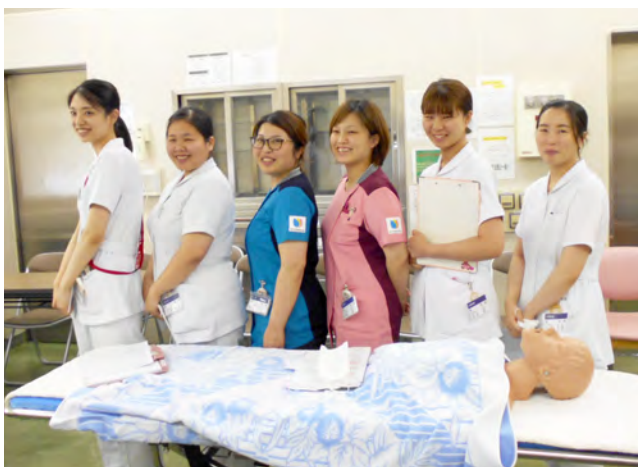
▲ 新人看護師と指導看護師

急変時の対応では、個人の知識や技術だけではなくチームワークが必要不可欠です。今後も訓練を繰り返すことで急変時の対応が迅速に行われ、患者さんの救命につながるよう技術と知識を深めていきます。