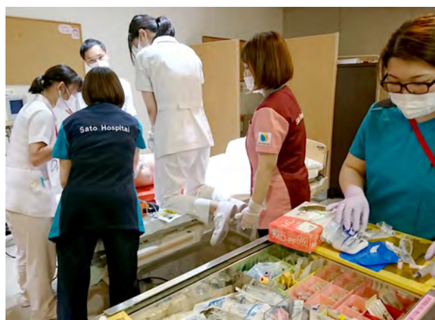
▲ 病棟での訓練(薬剤準備)