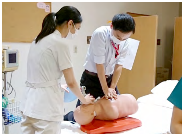
▲ 病棟での訓練(心臓マッサージ)