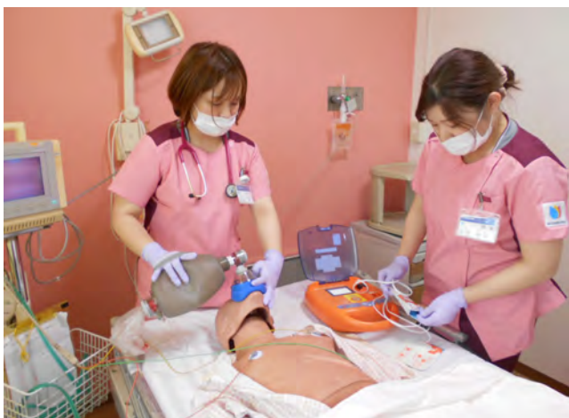
▲ 病棟での訓練(アンビューバック装着)