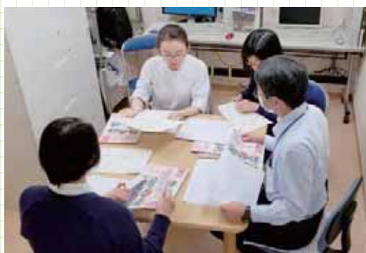
広報誌そよかぜ発送作業風景