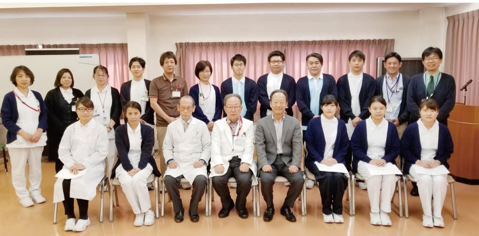
新人研修を終えて新しく迎えた仲間たちと一緒に記念撮影