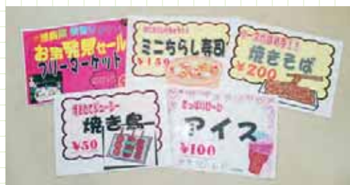
秋祭りポップ作成