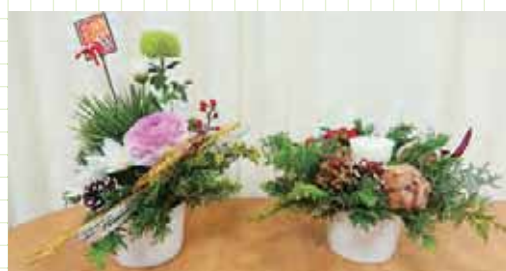
フラワーアレンジメント教室