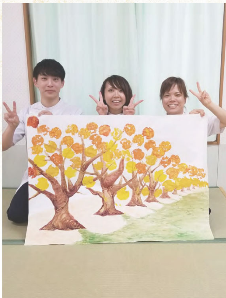
入院患者さんと作業療法士で作った作品です。葉のスタンプを患者さんに押ししてもらいました。