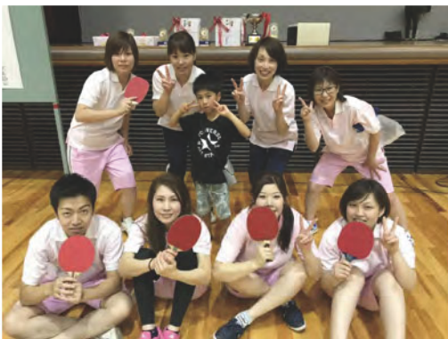
第54回病院職員卓球大会

抜群のチームワークで、試合中は笑顔があったり真剣な表情があったりと、普段とは違った職員の姿を見ることができました。惜しくも決勝トーナメントに進出することはできませんでしたが、来年も是非出場したいと思います！