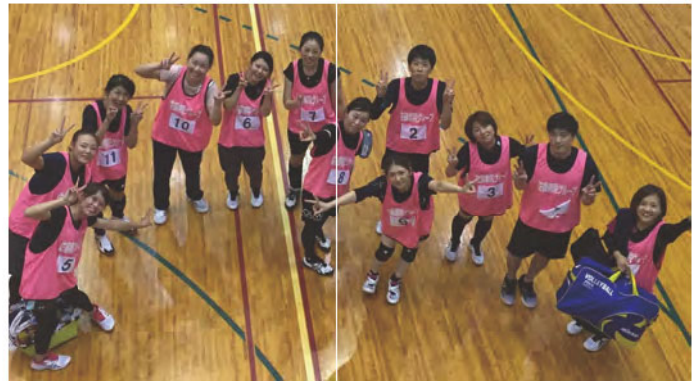
第33回病院職員バレーボール大会