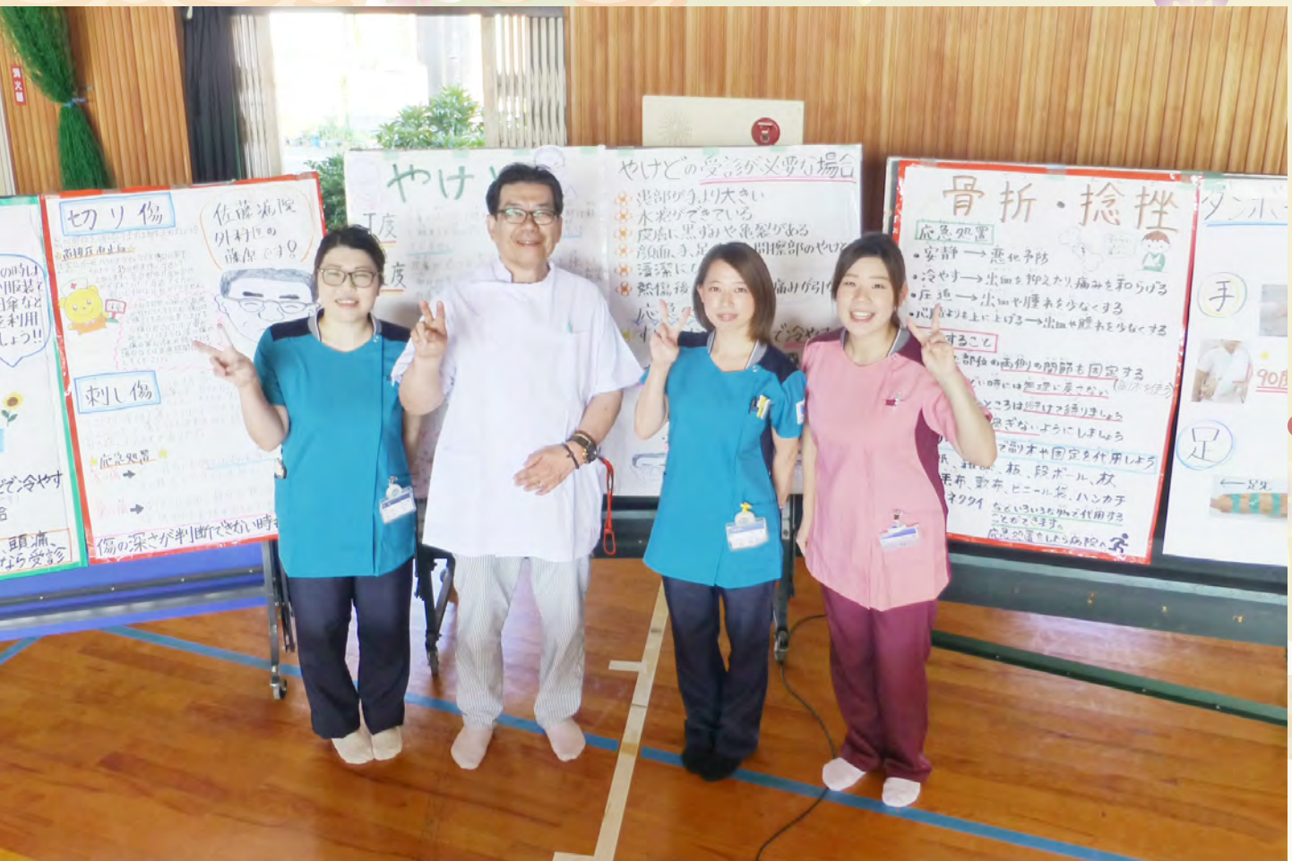
岡南公民館・福島学区連合町内会合同防災避難訓練に参加しました。