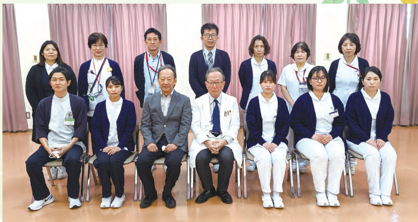
令和4年度 新人職員集合写真